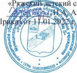
ГРАФИК проведения специальной оценки условий труда на рабочих местах

УТВЕРЖДЕН: Заведующий МДОУ «Рязанский детский сад № 5» Андрева Приказ от 17.01.2020 № 1