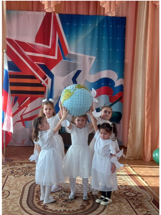
Шанец «Голубь мира» исполнили девочки средней и 2 младшей группы.